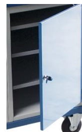
882 006 037 – 1 étagère supplémentaire pour bloc porte réglable au pas de 55 mm (4 maxi, 9 emplacements possibles)