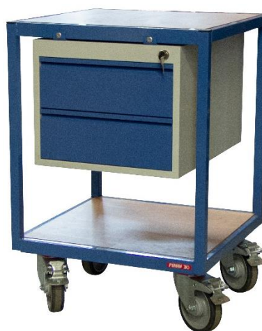
880 010 599 – 1 bloc 2 tiroirs