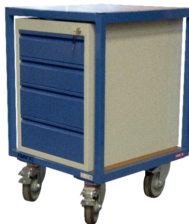
880 010 596 – 1 bloc 4 tiroirs