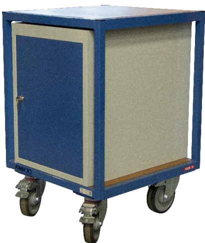
880 010 597 – 1 bloc porte