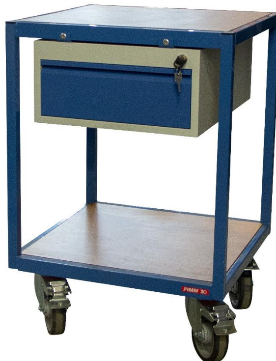
880 010 598 – 1 bloc 1 tiroir