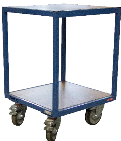
880 010 502 – Sans équipement