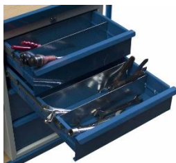
882 006 036 – 6 cloisons pour tiroirs hauteur 100mm