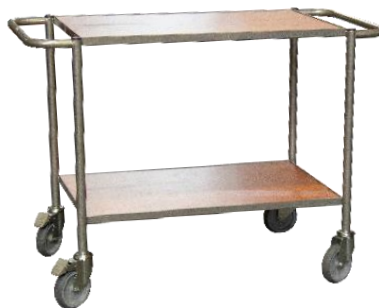
Desserte double poignée CU 150 kg