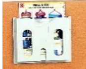
802 000 001 Porte document plastique autocollant