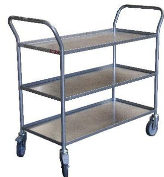
Desserte plateaux tôle CU 200 kg