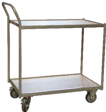
Desserte poignée verticale CU 250 kg