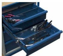
882 006 036 – Cloisonnements pour tiroirs hauteur 100 mm. 6 cloisons incluses.