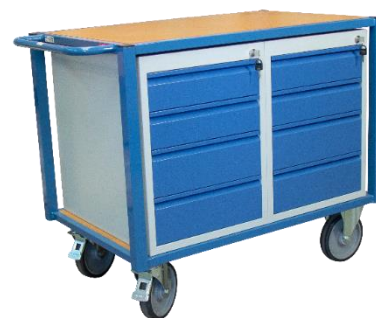
Modèles en blocs 4 tiroirs