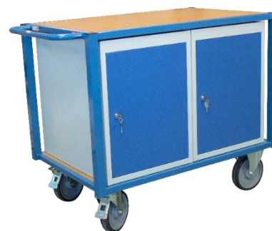
Modèles en blocs porte