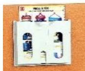
802 000 001 Porte document plastique autocollant