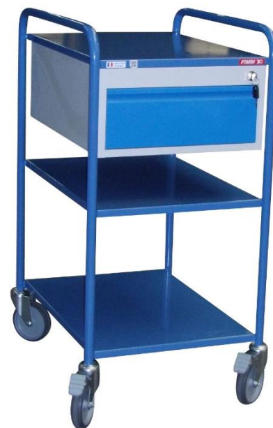
880 008 446 – 3 plateaux et 1 tiroir