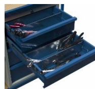
882 006 036 Lot de 6 cloisons pour tiroirs