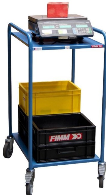
880 008 443 – 2 plateaux