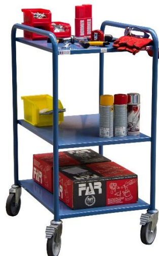
880 008 444 – 3 plateaux