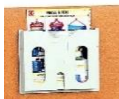
802 000 001 Porte document plastique autocollant