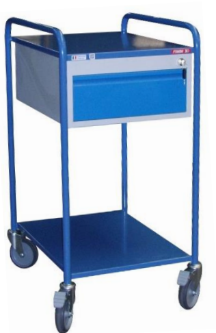
880 008 445 – 2 plateaux et 1 tiroir