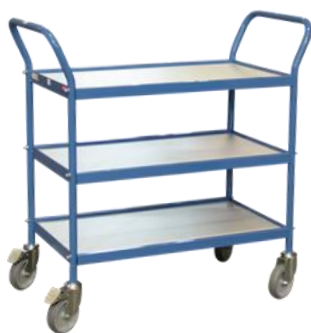
Servante 2 poignées vertical Capacité 150 kg