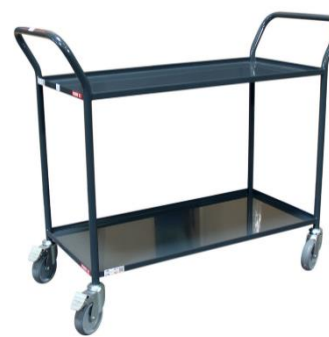
Servante plateaux tôle Capacité 200 kg