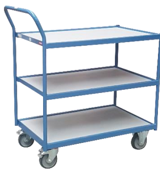
Servante 1 poignée horizontale Capacité 250 kg