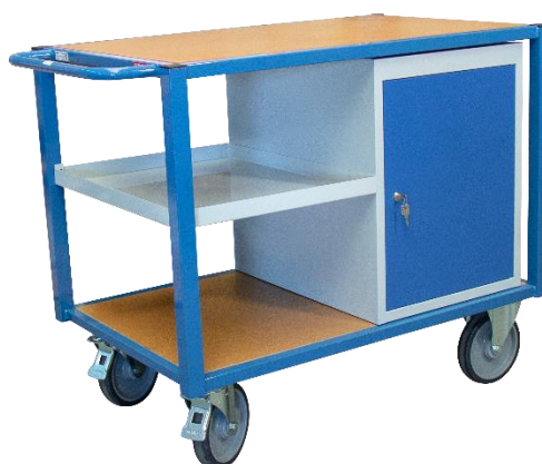
880 002 988 – ½ plateau tôle + 1 bloc porte