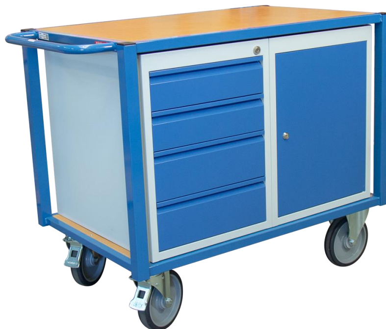
880 002 991 – 1 bloc porte et 1 bloc tiroirs