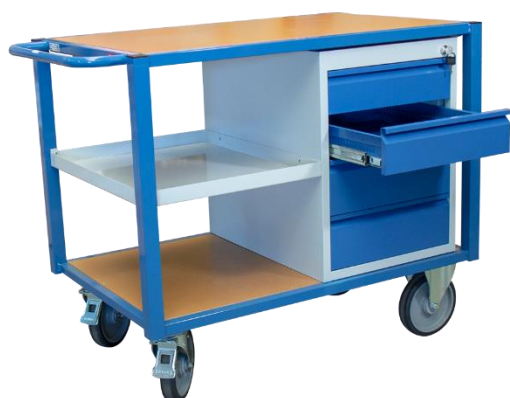
880 002 989 – ½ plateau tôle + 1 bloc 4 tiroirs