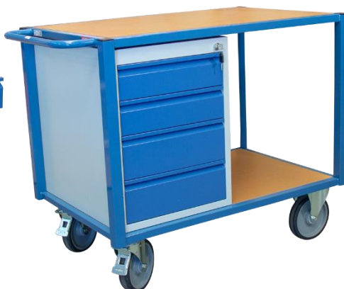
880 002 988 – 1 bloc tiroirs