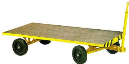
Sur couronnes à billes - 1 essieu directeur