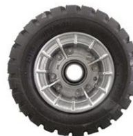
Ø 450 mm pour les remorques CU 5T 872 000 159 – pour remorques CU 5T 872 000 435 – pour remorques CU 5T et plateaux 3000 x 1500 ou 4000 x 1800 mm