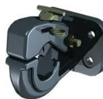
872 000 428 Pour remorques CU 5T