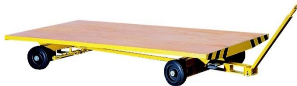
Sur fusées articulées - 2 essieux directeurs