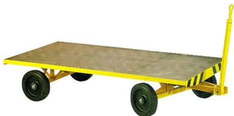
Sur couronnes à billes - 1 essieu directeur