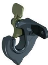
872 000 412 Pour remorques CU 2T et 3T

Pas de possibilité d'inversion du sens de traction.