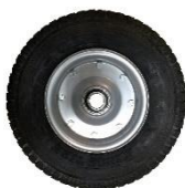
Ø 400 mm pour les remorques CU 2T et 3T 872 000 419 – pour remorques CU 2T 872 000 427 – pour remorques CU 3T et plateaux 2000 x 1000 ou 2520 x 1250 mm

Ces jantes permettent le changement aisé du bandage.