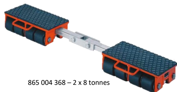
865 004 368 – 2 x 8 tonnes