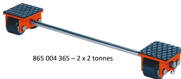
865 004 365 – 2 x 2 tonnes

La charge doit être répartie sur les rouleurs en fonction de son centre de gravité. Les rouleurs ajustables doivent toujours être positionnés à l'arrière de la charge.