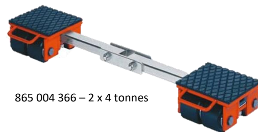
865 004 366 – 2 x 4 tonnes