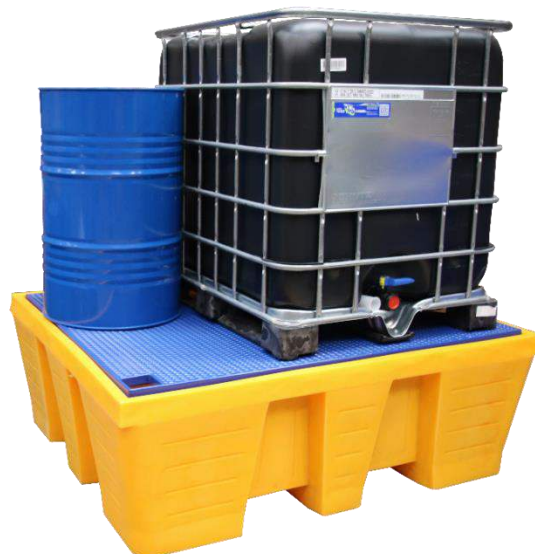
845 006 632 1 transicuve / 4 fûts