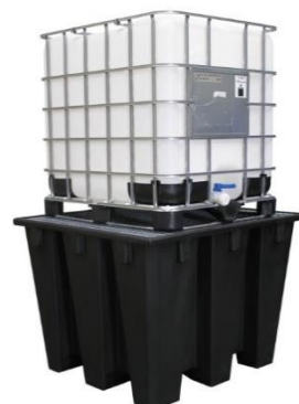
Bac en PE recyclé capacité 1100 L