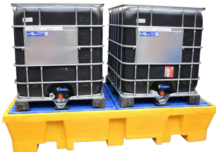
845 006 625 2 transicuves / 8 fûts