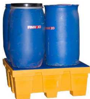
Bac avec caillebotis en PEHD capacité 450 L