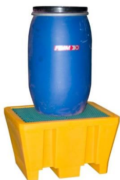
Bac avec caillebotis en PEHD capacité 225 L