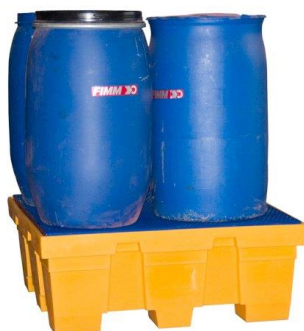
Bac avec caillebotis en PEHD capacité 450 L