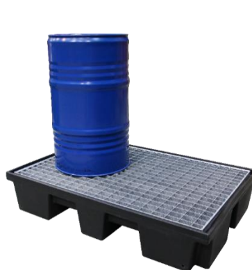
845 006 657 2 fûts, caillebotis acier galvanisé