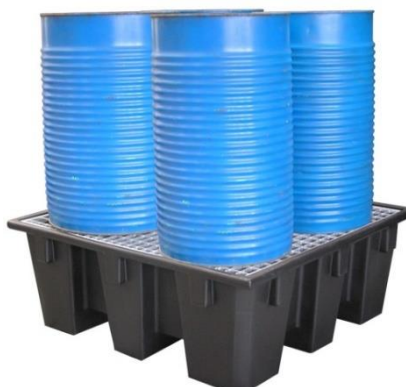
845 009 506 4 fûts, caillebotis acier galvanisé