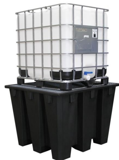
845 009 505 1 transcuve, caillebotis acier galvanisé