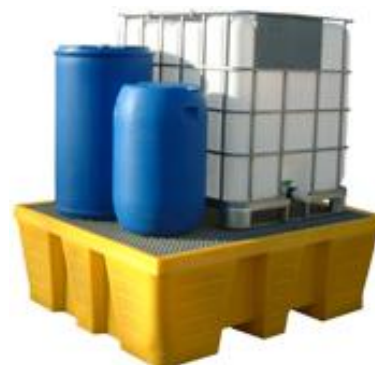
Bac avec caillebotis acier galvanisé capacité 1000 L