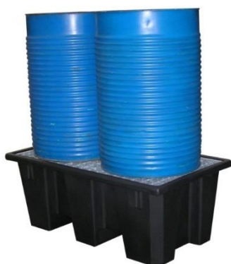
845 009 504 2 fûts, caillebotis acier galvanisé