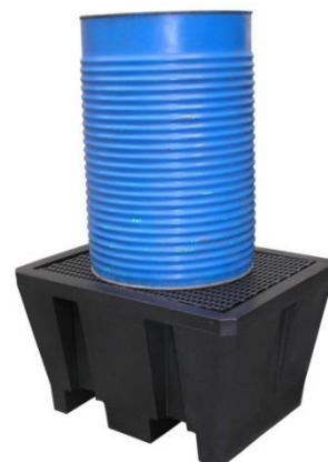
845 009 503 1 fût, caillebotis PEHD