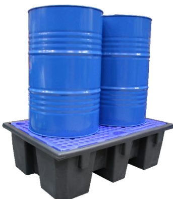
845 006 655 2 fûts, caillebotis PEHD