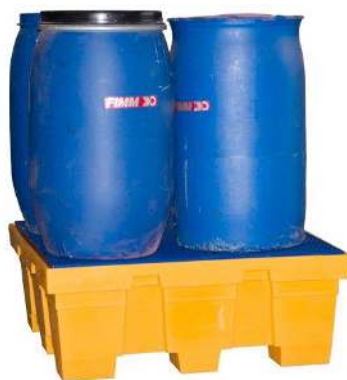
845 006 632 4 fûts