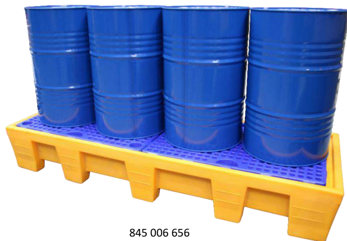
845 006 656 4 fûts