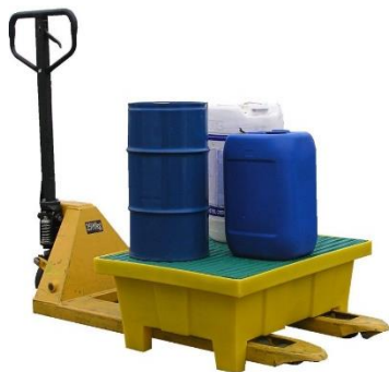
Bac avec pieds capacité 70 L