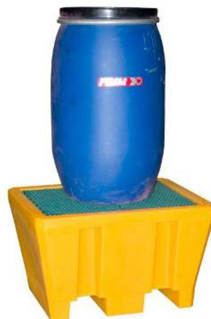
845 006 625 1 fût