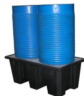
Bac en PE recyclé capacité 220 L