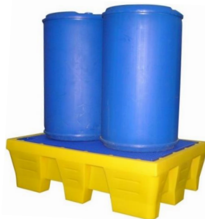
845 006 623 2 fûts