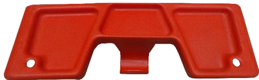
Large porte outils en nylon