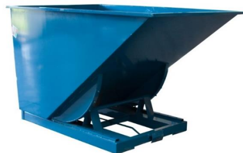
Bennes auto-basculantes 150 à 3000 L