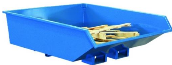
Bennes surbaissées auto-basculantes 550 à 900 L