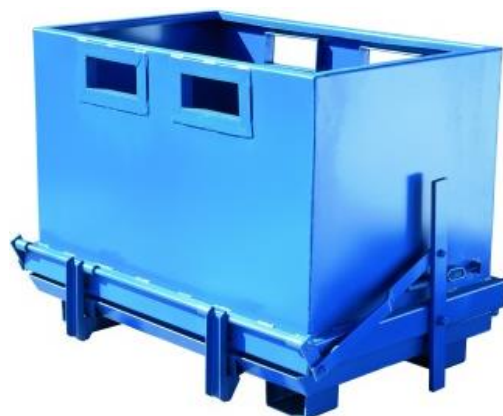
Bennes d'atelier à fond ouvrant, de 700 à 1800 L.