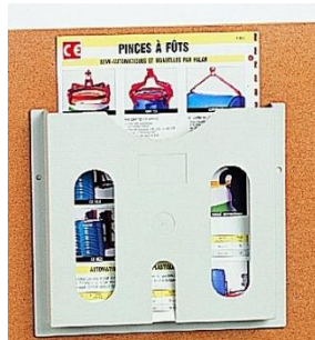
Porte-documents plastique – 802 000 001