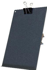
Porte-documents A4 debout – 802 000 012

Compatibilité : Pupitres, modèles avec blocs porte et 4 tiroirs