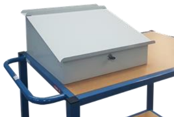
Pupitre à poser avec écritoire verrouillable – 882 006 039