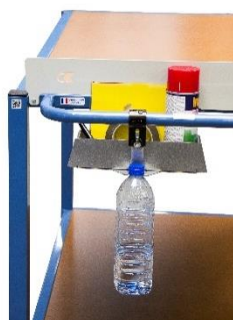
Panier en tôle et porte-bouteille intégré – 882 009 529

Boîte à outils et porte-bouteille intégré. Permet à l'opérateur de transporter des accessoires dans une boîte en tôle de dimensions : 280x80x70mm et de tenir une bouteille d'eau de 25 cl à 1,5L.