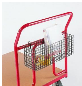
Panier à fil – 802 000 002