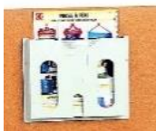
802 000 001 Porte document plastique autocollant